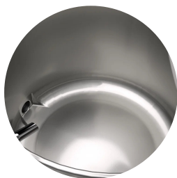
Edelstahltank mit Boden aus Aisi 316