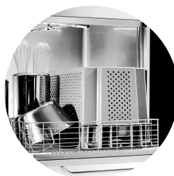
Porta in doppia parete