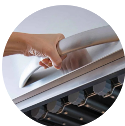
Sistema di filtrazione EASY+

ALL-IN-1 Questo sistema innovativo è stato sviluppato per facilitare la manutenzione e la pulizia giornaliera della macchina