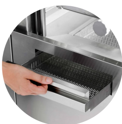
rivoluzionario sistema di filtrazione garantisce all'utilizzatore finale un processo di filtrazione a 3 step