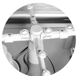
Impulsores ligeros de material compuesto, eficientes incluso a baja presión de red