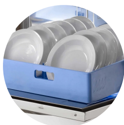
Porta in doppia parete