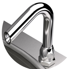
Posibilidad de carga de agua caliente o fría