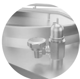
Cubetas indirectas con válvula automática de purga de condensados