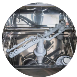
Moulded and sloping basin for perfect emptying