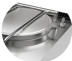
Posibilidad de carga de agua caliente o fría