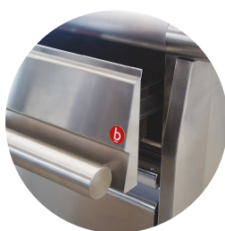
Cajones para GN 1/1

Gracias a la certificación a prueba de chorros (IPX5) obtenida mediante pruebas específicas, los pomos y bajopomos pueden lavarse al final de la jornada laboral sin comprometer la funcionalidad ni la seguridad.