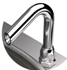
Posibilidad de carga de agua caliente o fría