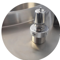
Edelstahltank mit Boden aus Aisi 316