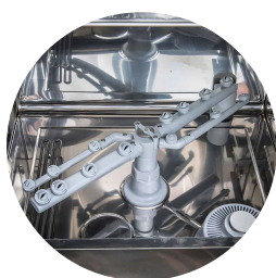
Cubeta moldeada e inclinada para un vaciado perfecto